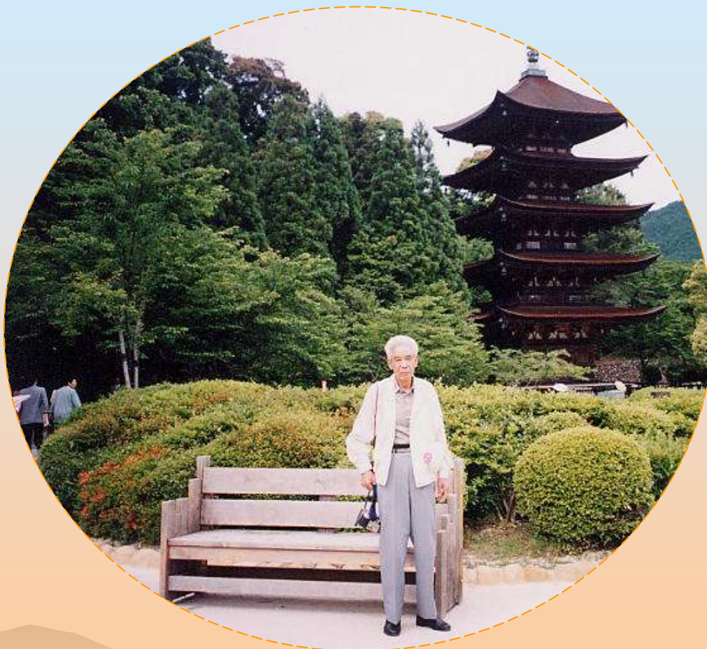
西の京・山口[瑠璃光寺]国宝五重塔